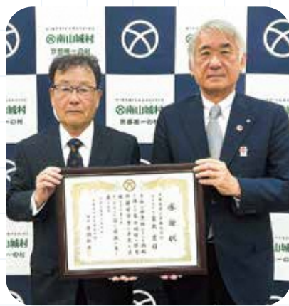
左から裏出代表取締役、平沼村長

法人名 裏出建設工業株式会社 本社 京都府相楽郡精華町大字 南福八妻小字堂垣内22番地 事業内容 土木工事・建設工事等 寄附年月日 令和6年10月10日 寄附額 100万円