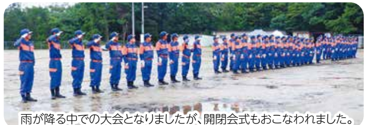
雨が降る中での大会となりましたが、開閉会式もおこなわれました。