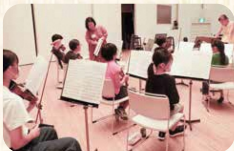
写真は2023年度のものです。