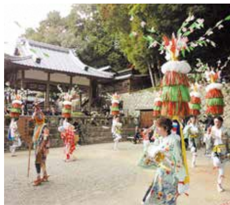
南山城村田山の花踊り

笹の葉踊りや花踊りの具体的な姿はわかりませんが、現在も南山城村田山で行われている「花踊り」のような雨乞いにもなる芸能が、和束でも実施されていたことがわかります。